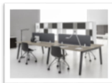
DV 804 - E Place