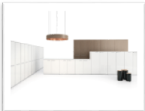
DV 503 - Storage