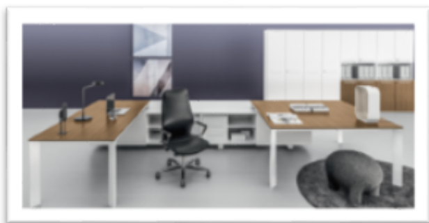
DV 901 - Vertigo