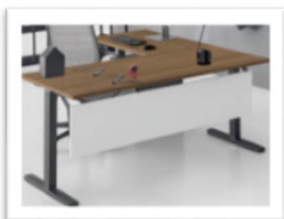
DV 803 - Nobu