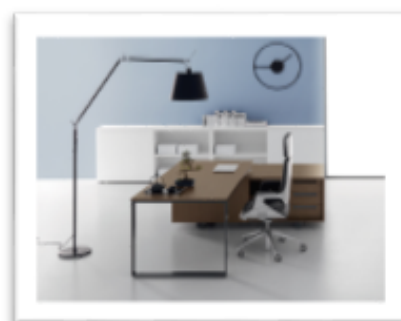
DV 902 - Planeta