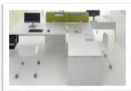
DV 805 - Treko